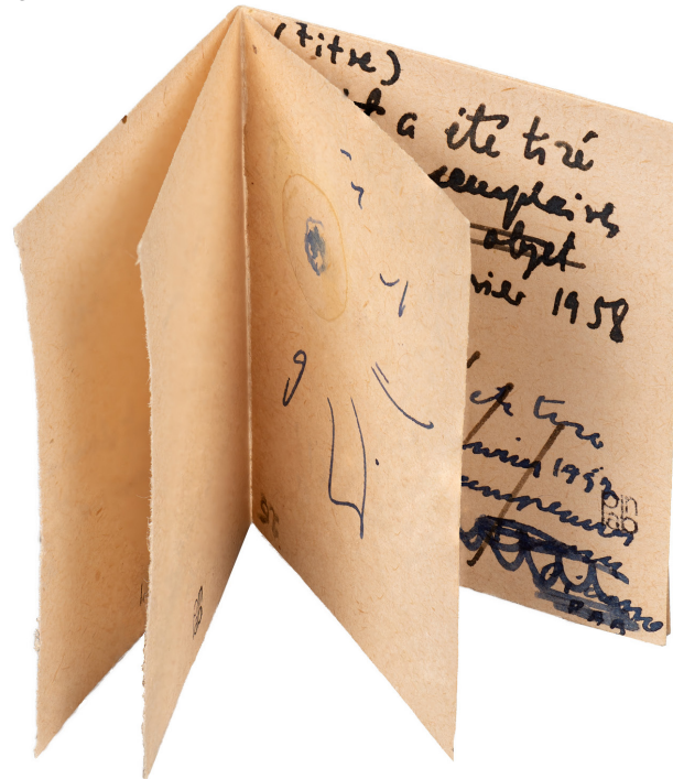
PAB, maquette minuscule à l'encre bleue de La Rose et le chien , annotée en noir par Tristan Tzara (BnF, Réserve des livres rares, fonds PAB, lettre de Tristan Tzara à PAB du 4 janvier 1958). fig. 5