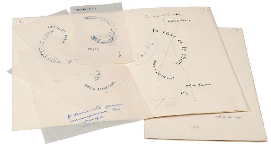
PAB, essais autographiques et épreuve typographique pour la page de titre de La Rose et le chien , annotée par Tristan Tzara (BnF, Réserve des livres rares, RES 4-Z PAB ED-27). fig. 7